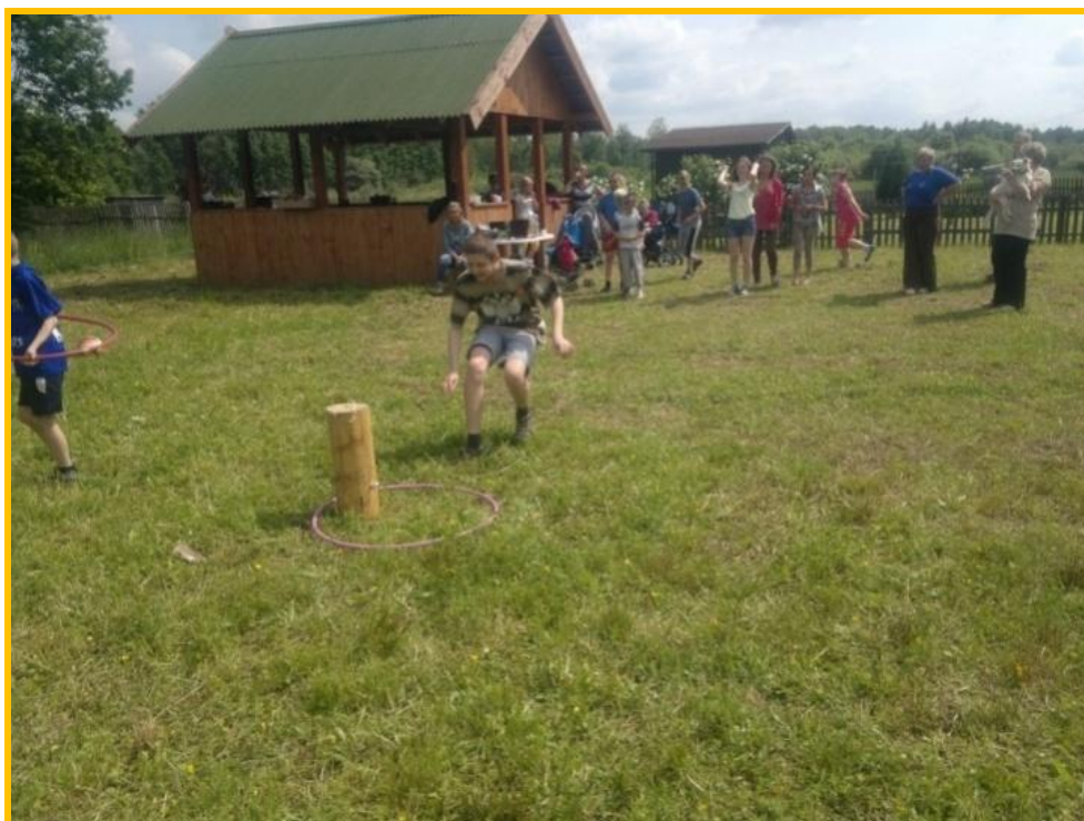
Biedkowo-Osada – Dzień Dziecka (01-02.06.2013r.)

Co roku mieszkańcy sami organizują i przygotowują imprezy takie jak: imprezy okolicznościowe (Choinka, Dzień Dziecka), kuligi, coroczny piknik rodzinny.