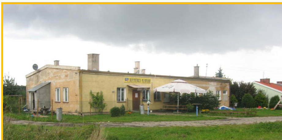
Biedkowo–Osada – sklep spożywczo-przemysłowy

Mieszkańcy Biedkowa-Osady są w przeważającej większości osobami bezrobotnymi i utrzymują się z prac sezonowych m.in. w okresie zimowym przy zbiorze trzciny nad Zalewem Wiślanym, w sezonie wiosenno-jesiennym w lasach (zbiór jagód, grzybów, prace zlecane przez nadleśnictwa związane z gospodarką leśną), także sezonowo przy zbiorach borówki amerykańskiej i truskawek. Część z nich znajduje zatrudnienie w ramach prac interwencyjnych lub robót publicznych organizowanych przez Urząd Miasta i Gminy we Fromborku.