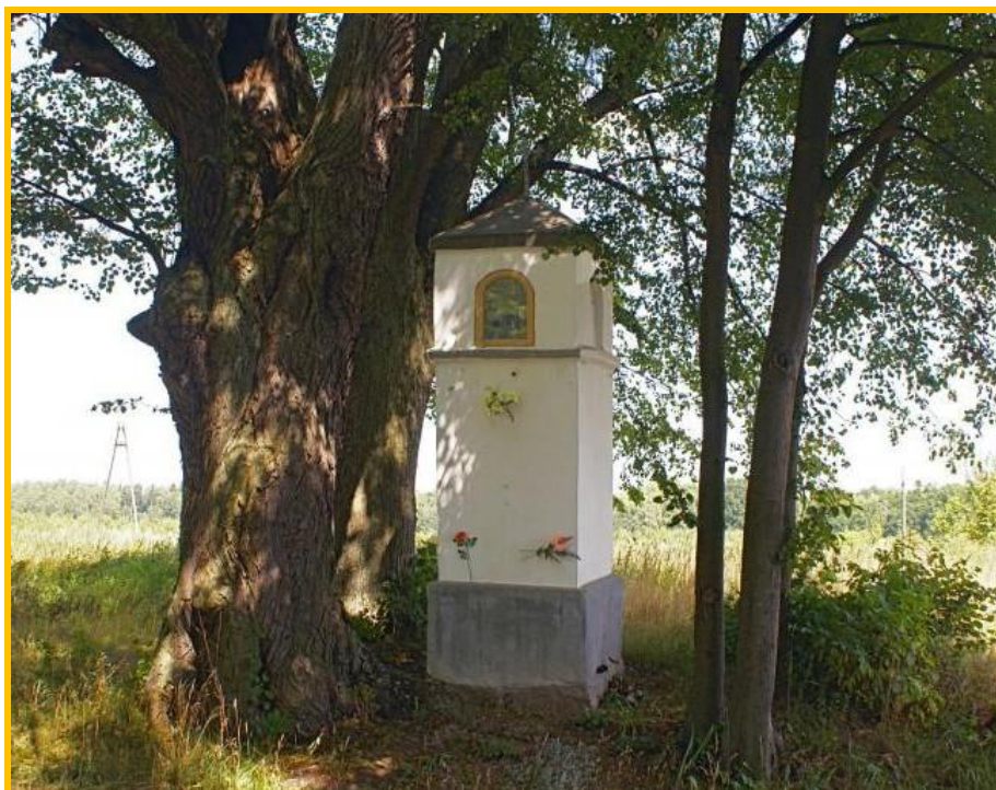
Kapliczka w miejscowości Biedkowo

Zachowanym obiektem zabytkowym na terenie sołectwa Biedkowo jest kapliczka neoklasycystyczna, dwukondygnacyjna, z daszkiem czterospadowym, zwieńczonym metalowym krzyżem, która znajduje się w ciągu drogi powiatowej nr 1165N.