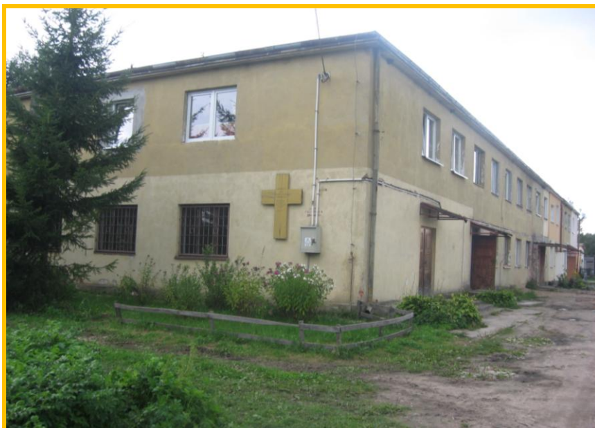
Biedkowo – Osada – kaplica parafii fromborskiej

Miejscowości Biedkowo i Biedkowo-Osada tworzą jedno z jedenastu sołectw Gminy Frombork. Usytuowane są w atrakcyjnej, malowniczej okolicy, wśród lasów, a jednocześnie w stosunkowo niedaleko od centrum gminy – Fromborka. Ze względu na malownicze położenie oraz walory przyrodnicze miejscowości mają ogromne możliwości turystyczne.