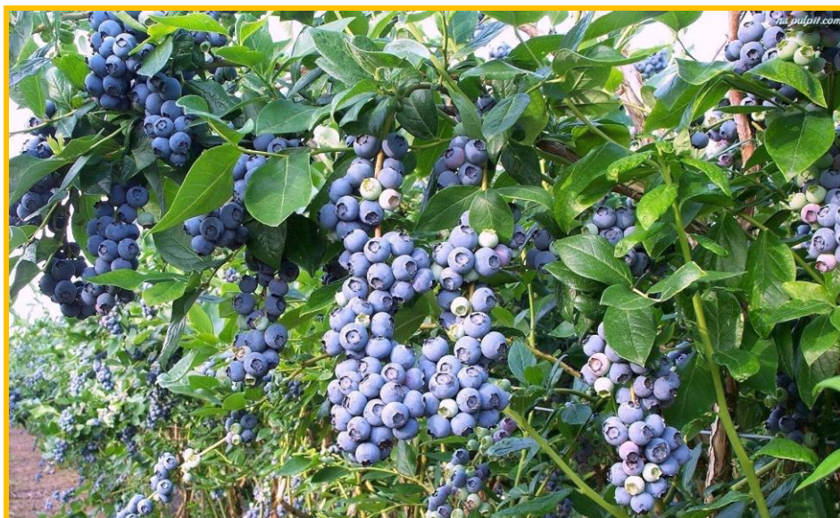
Biedkowo-Osada – plantacja borówki amerykańskiej