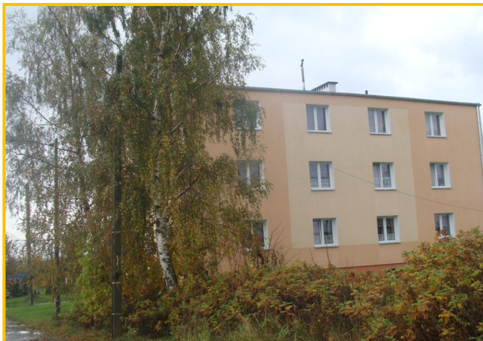
Biedkowo-Osada – blok mieszkalny

W miejscowości Biedkowo-Osada przecina się kilka dróg, niektóre z nich są utwardzone płytami betonowymi, a niektóre są gruntowe. Droga główna przebiegająca przez obie miejscowości jest drogą asfaltową.