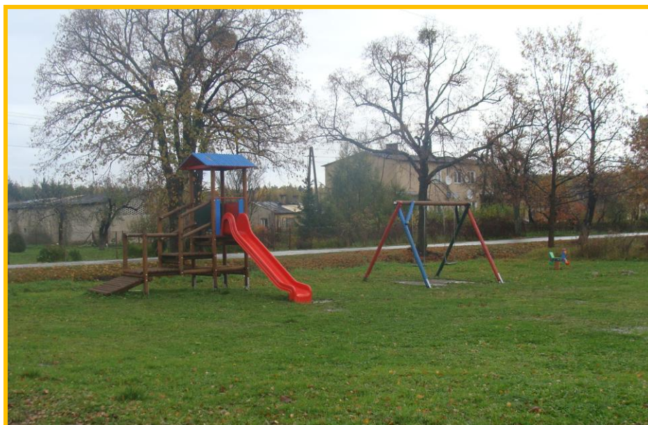
Plac zabaw a miejscowości Biedkowo-Osada

W miejscowości Biedkowo-Osada znajduje się kaplica parafii fromborskiej oraz sklep. Miejscowość dysponuje terenem pod boisko sportowe i plac zabaw dla dzieci oraz pod budowę świetlicy wiejskiej. W odległości ok. 600 m od drogi krajowej nr 54 znajduje się zadaszony przystanek autobusowy.