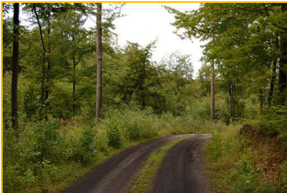
Biedkowo – kompleks leśny

Środowisko przyrodnicze okolic Biedkowa i Biedkowa-Osady charakteryzuje się wysokimi walorami krajobrazowymi i wysokim stopniem czystości powietrza. Warunki te składają się na potencjał turystyczny miejscowości.