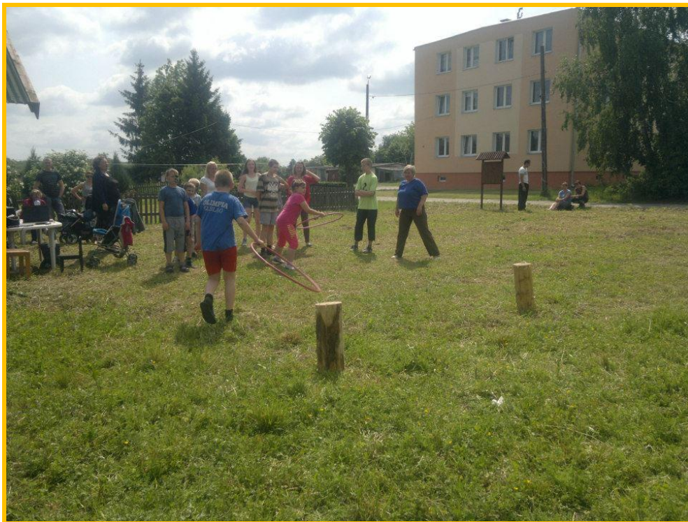
Biedkowo-Osada – Dzień Dziecka (01-02.06.2013r.)