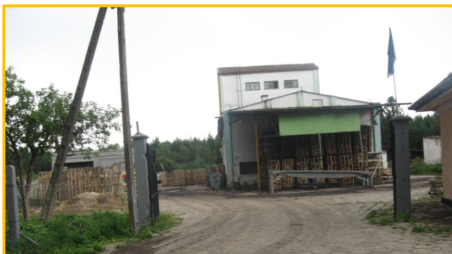
Biedkowo-Osada – zakład produkujący drewno kominkowe